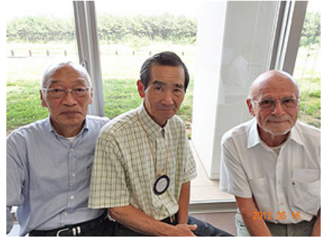
ビジターのお二人と梶田会員