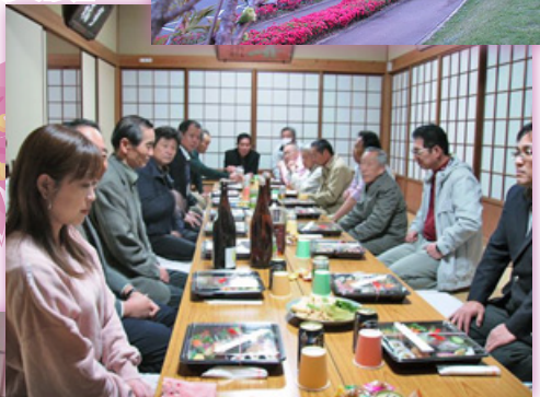
◀「観桜会宴会の様子」