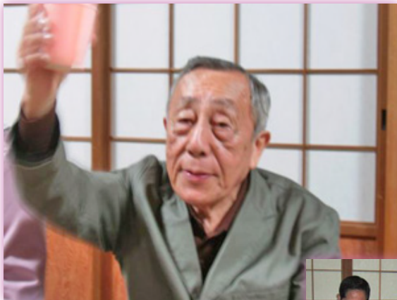
▲「垂水さん乾杯の挨拶」