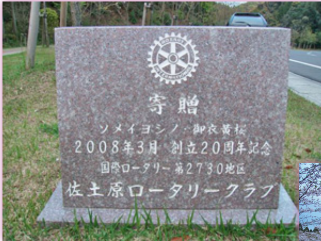
◀「クラブ植栽記念碑」