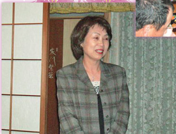
▼「戸敷宮崎市長夫人」