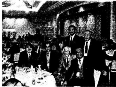
西都クラブの20周年記念事業に我がクラブからも多くの会員が参加しました。効率の良い式典の流れで行われ、良い参考になりました。

このことを実行することは、難しいことですが十分の一でも実行することが大事です。人格形成向上のためです。すなわち徳のある人になります。幸せな人生を歩むことができます。