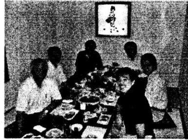
炉辺会合のひとつコマです。少人数だと活発な意見がたくさん飛び出します。岩切年度も続けたいものですネ！