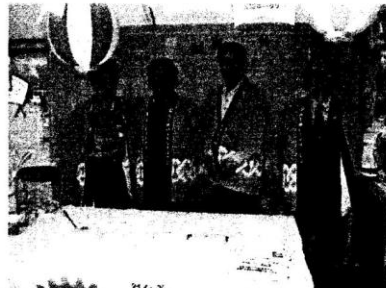
佐土原特産祭りでのひとつコマです。初めても試みでしたので、うまく出来るか心配でしたが、終わってみると予想以上の成果がありました。また機会があれば工夫をこらして参加したいものです