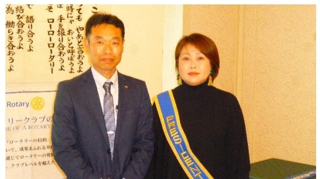
■ 例会の様子 ■