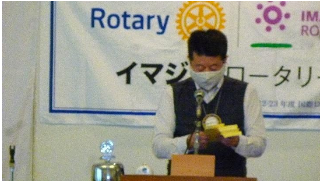
🌸 1 月度セレモニー 🌸