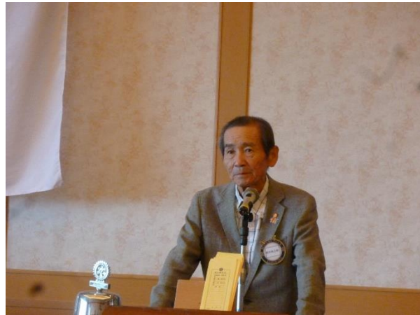
■ショートスピーチイルファン君へ、近況報告等