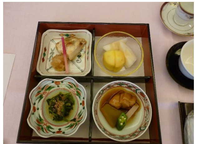
* 10/21=休会 * 10/28=夜間例会「串八にて」