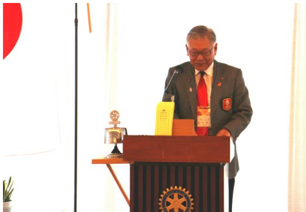
ガバナー 田中 俊實