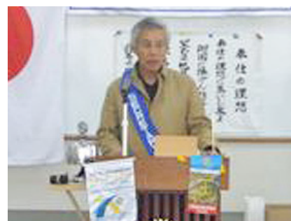
「ポリ加工業」の 最新状況等について