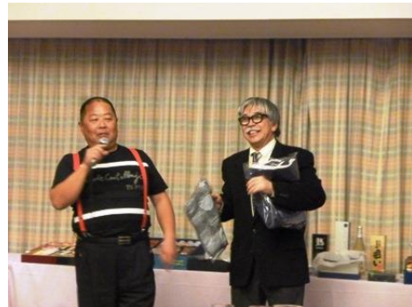
■ 目標の 20 万円達成しました☆☆☆ 皆様のご協力 誠に有り難う御座いました。