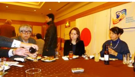
☆大久保会員～小牧会員のご夫人～♪