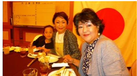
☆原田会員のご家族～♪