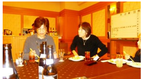
☆日高会員のご夫人と郡司会員のご夫人～♪