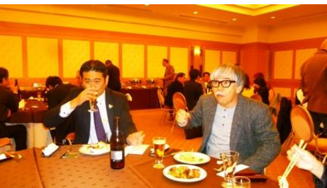
☆会長エレクトの郡司会員と舂田会員～♪