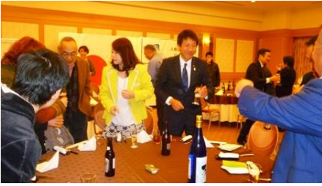
☆原田会員～永野会員～新原会員♪