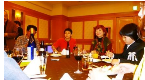
☆武政会員のご家族と小牧会員のご長男～♪