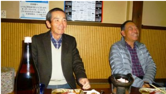
■ 岩切会長・梶田委員長より挨拶