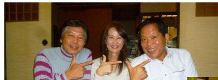
皆なぜかこのポーズです。