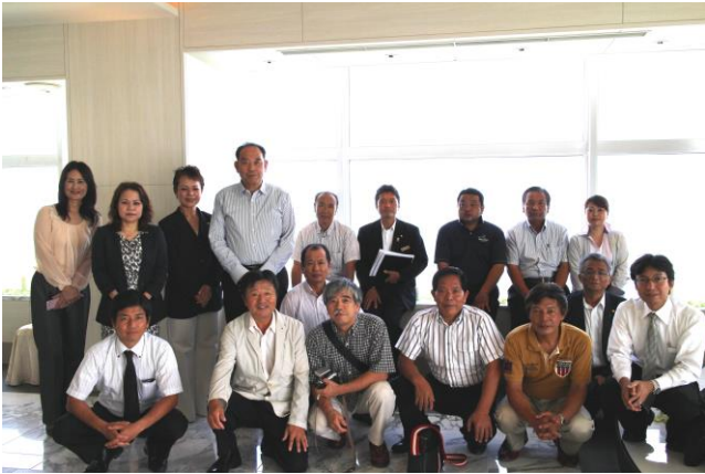
■ シェラトン・グランデ・オーシャン・リゾートホテル施設内見学の様子